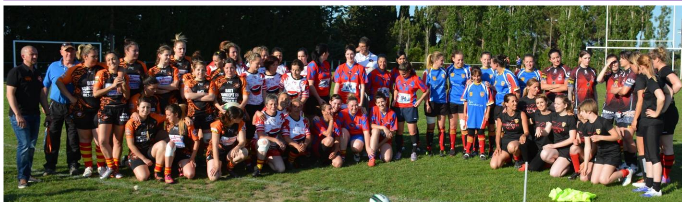
4 ème Tournoi féminin des Aspres « Rugby à Toucher »

Néanmoins, aux propriétaires des véhicules récalcitrants, nous rappelons également que les SEULS stationnements AUTORISÉS sur la Place sont ceux MATÉRIALISÉS. Leur indécatesse gênent les exposants et peuvent à force les démotiver : Nous allons donc demander à la Gendarmerie d'y passer dès 8h00.