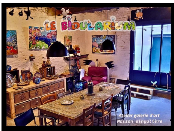
Atelier galerie d'art Maison singulière